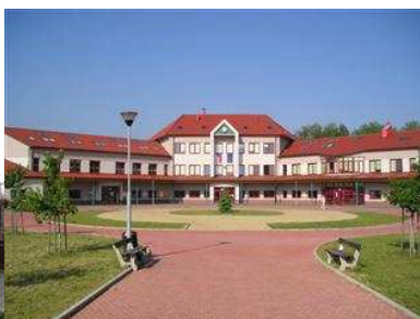
Nová budova (od roku 2003)

Základní školu navštěvuje 560 žáků ve 23 třídách, mateřskou školu navštěvuje 206 dětí v 8 třídách, základní uměleckou školu navštěvuje 260 žáků ve 4 oborech.