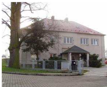
Stará budova (1879 - 2003)